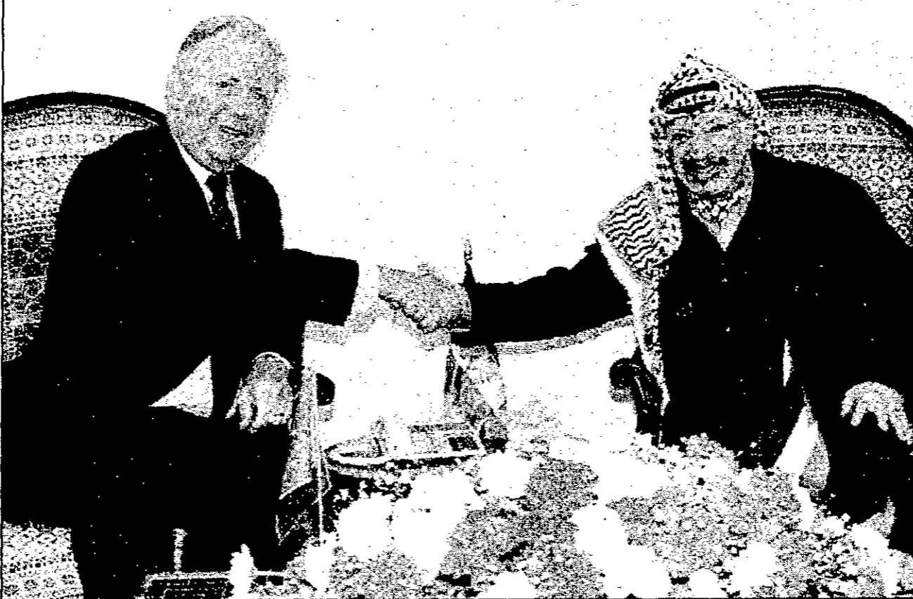
الرئيس الفلسطيني ياسر عرفات لدى استقباله رئيس المفوضية الأوروبية جاك سانتويرو امس في غزة